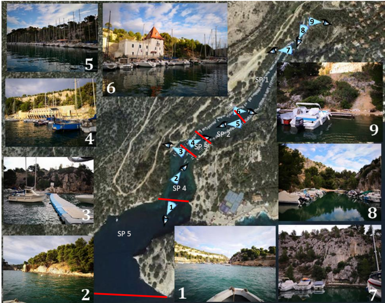
Reportage photographique sur les différentes séquences paysagères (Cabinet Ordener, 2020)