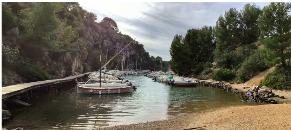
Vue depuis le fond de la calanque de Port Miou (2020)