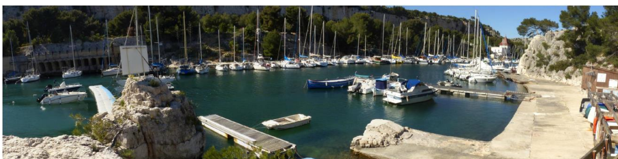
Vue depuis le secteur SCP en rive Est (2020)