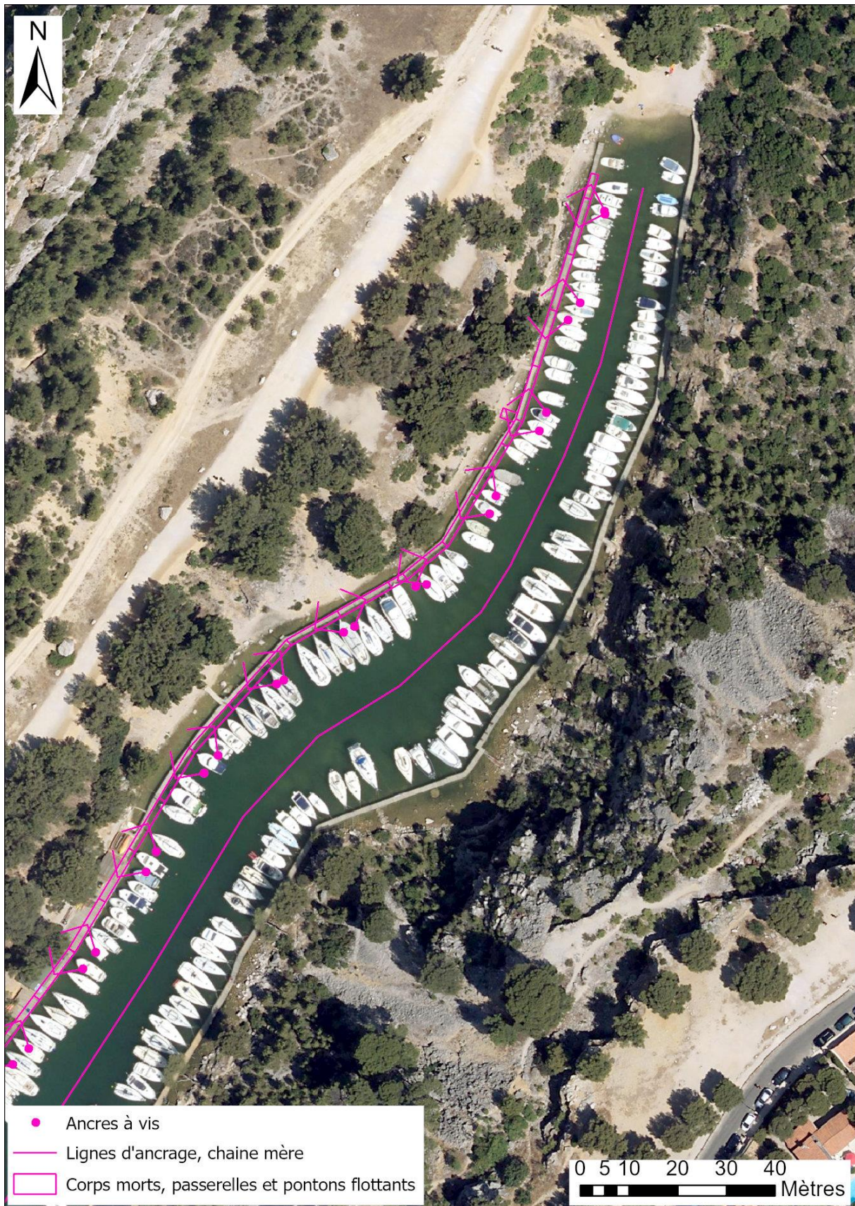
Schéma de principe d'implantation des pontons et de leurs systèmes d'ancrages selon les plans de TP SPADA 2023 (découpage en 4 vues d'Ouest en Est)