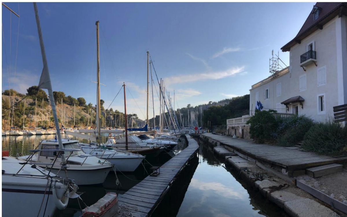
Vue des pontons fixes en rive Ouest devant la capitainerie (2020)