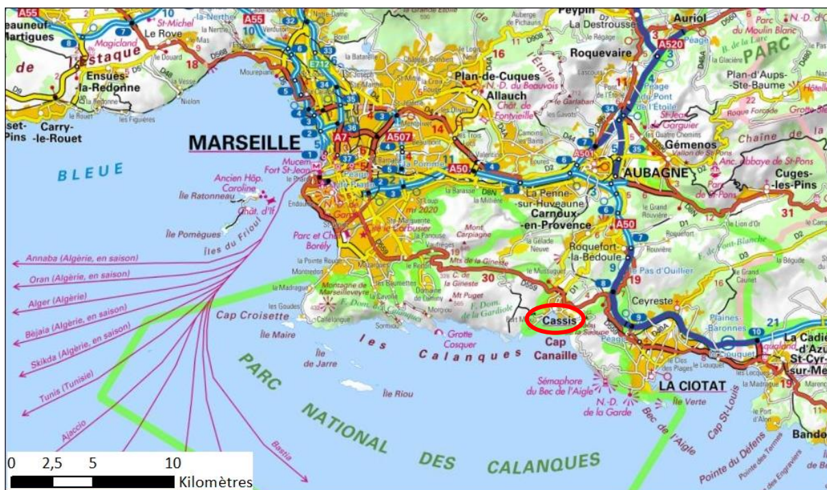
Plan de localisation de Cassis (○)