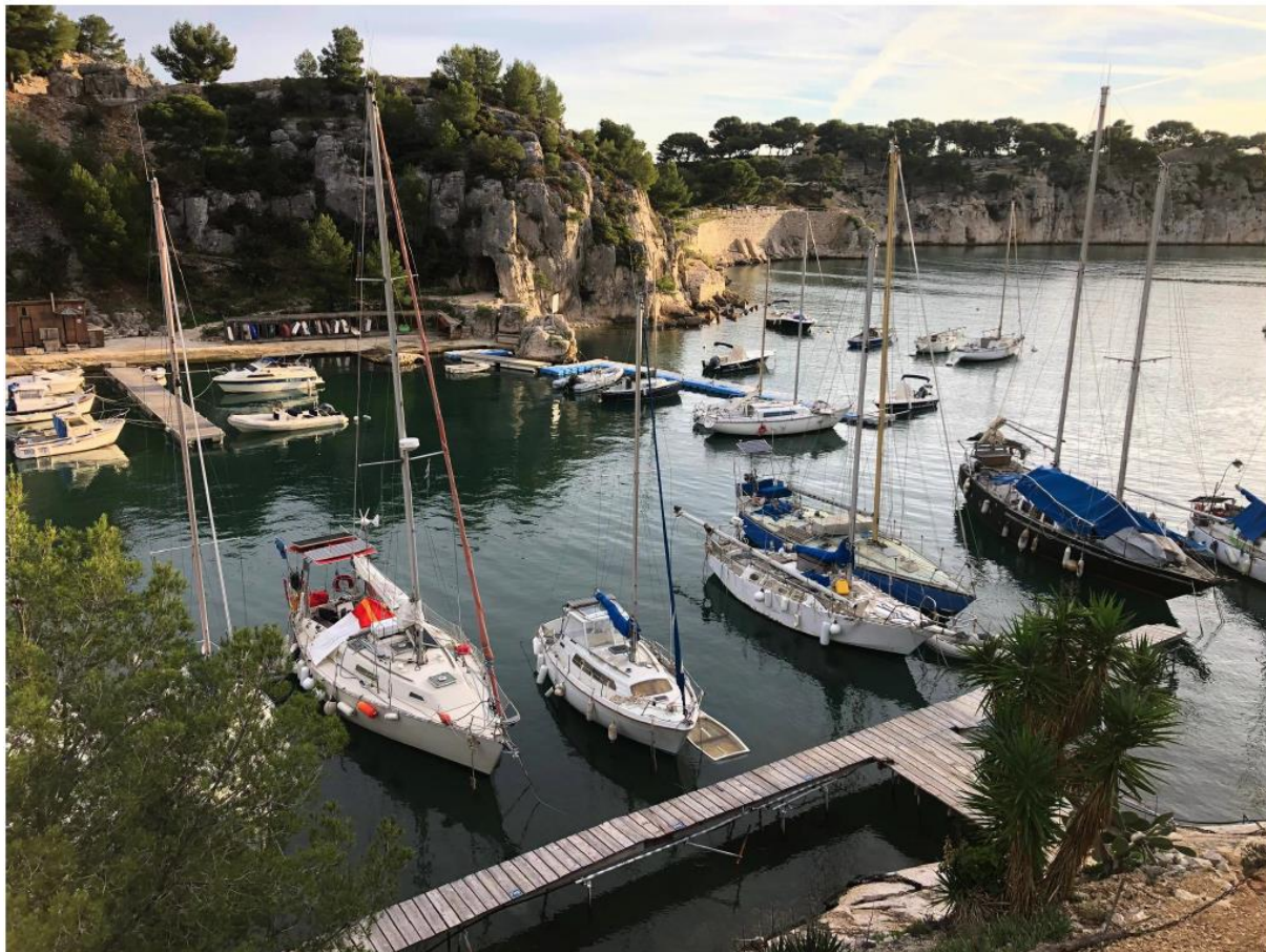
Vue du secteur SCP et de la zone de mouillage sur bouées depuis la rive Ouest (2020)