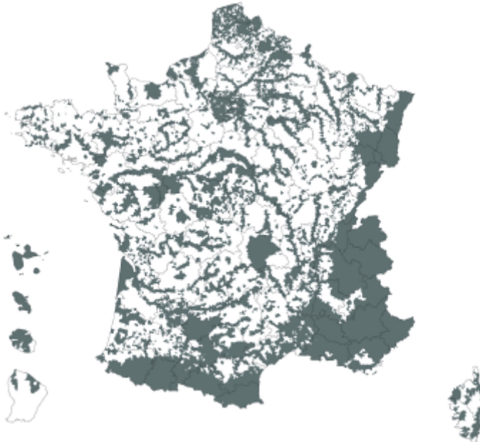
carte des communes de France où s'applique l'obligation d'établir un état des risques