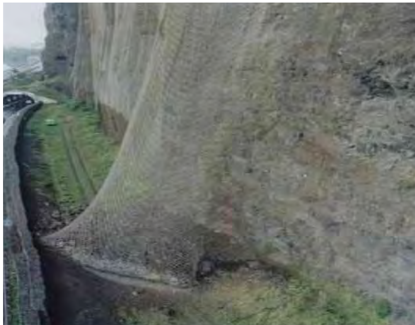
Déviateur – Filet / Grillage pendu