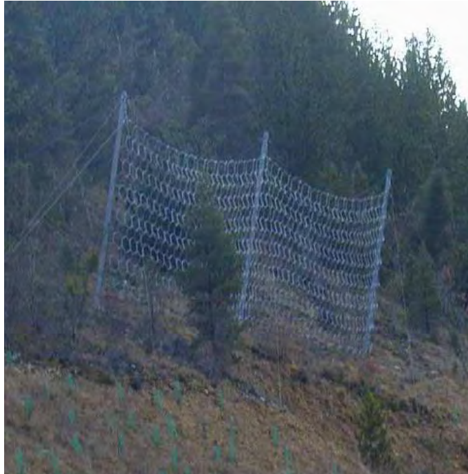
Ecran déformable de filet