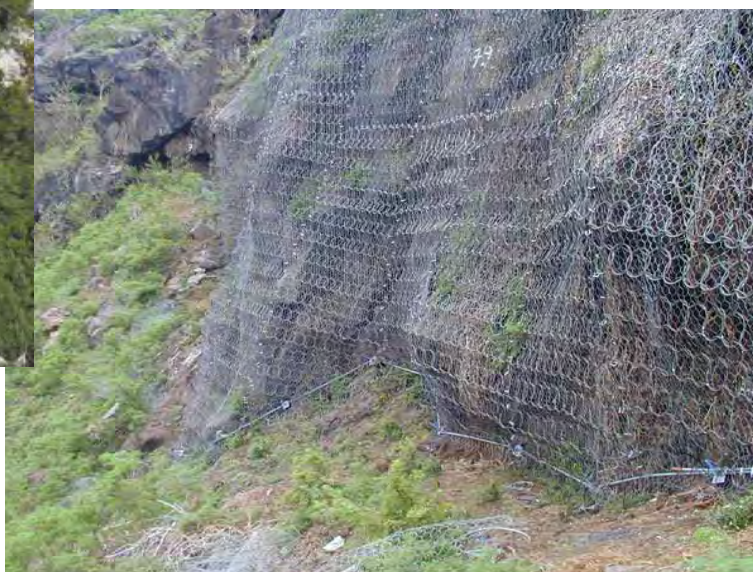
Filet / Grillage Plaqué