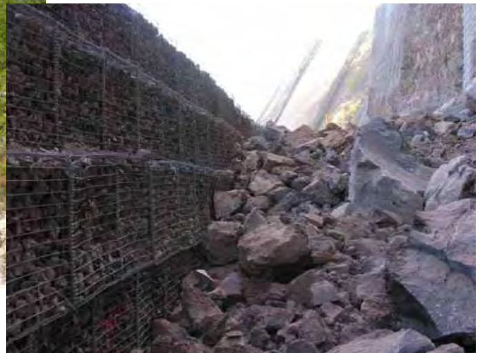
Ecran à structure rigide