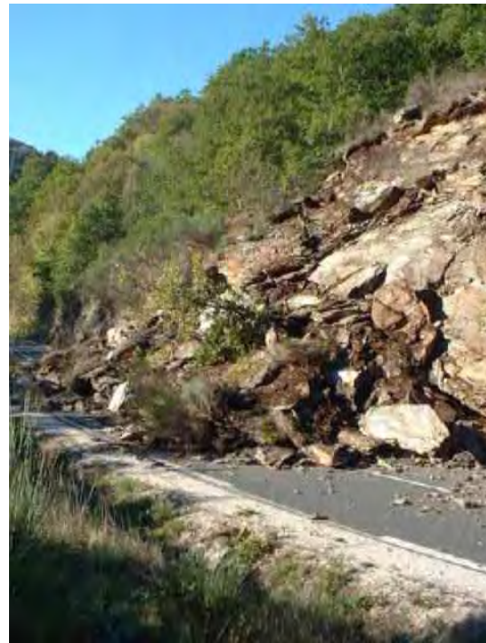
Élimination des masses instables et des masses éboulées (Purge, Abattage, Reprofilage) © CETE Méditerranée - Journée technique « Risque Rocheux »