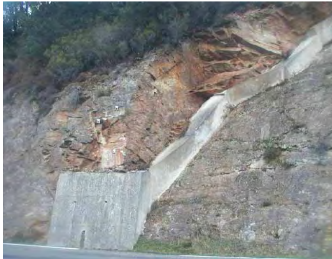
Soutènement (Buton, Contrefort, Mur ou Longrine) © CETE Méditerranée - Journée technique « Risque Rocheux »