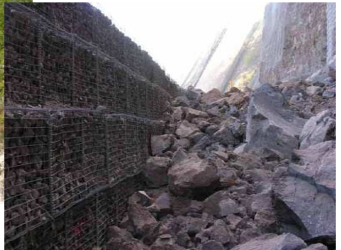
Ecran à structure rigide

© CETE Méditerranée - Journée technique « Risque Rocheux »