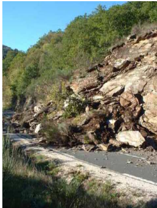
Élimination des masses instables et des masses éboulées (Purge, Abattage, Reprofilage) © CETE Méditerranée - Journée technique « Risque Rocheux »