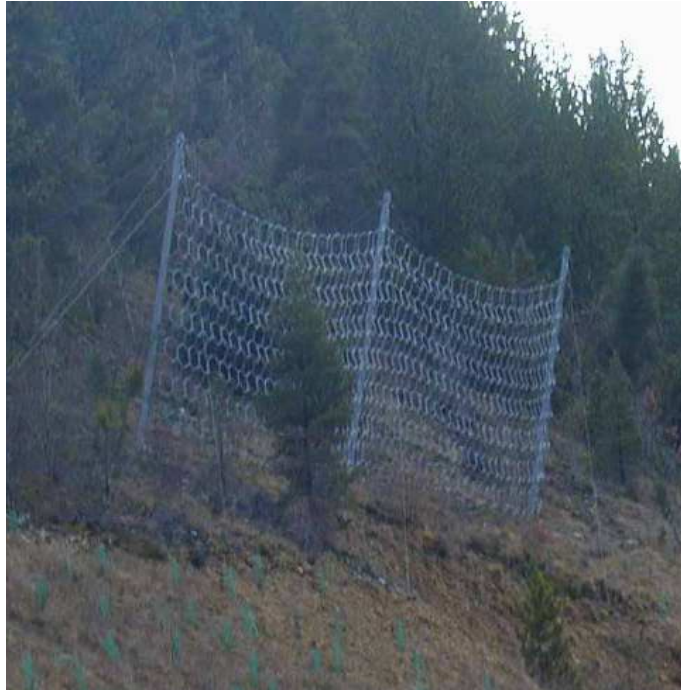
Ecran déformable de filet