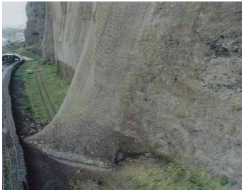
Déviateur – Filet / Grillage pendu