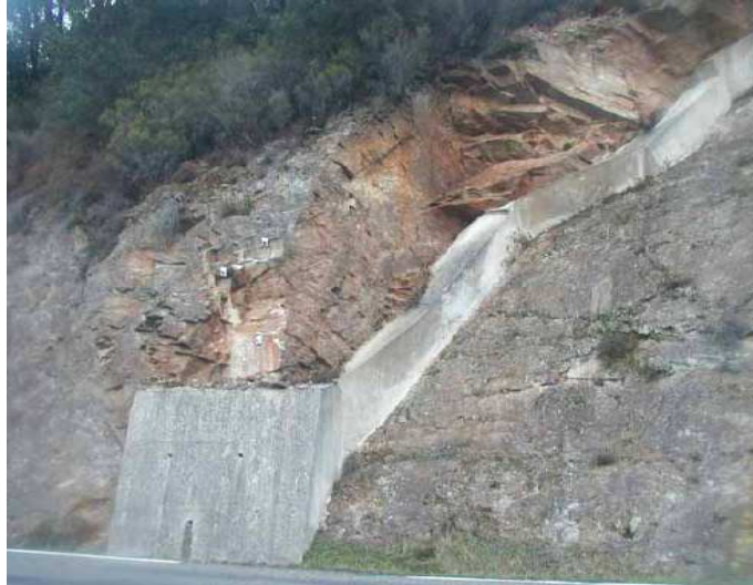
Soutènement (Buton, Contrefort, Mur ou Longrine) © CETE Méditerranée - Journée technique « Risque Rocheux »