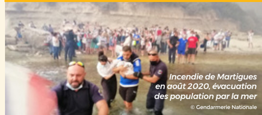
Incendie de Martigues en août 2020, évacuation des population par la mer